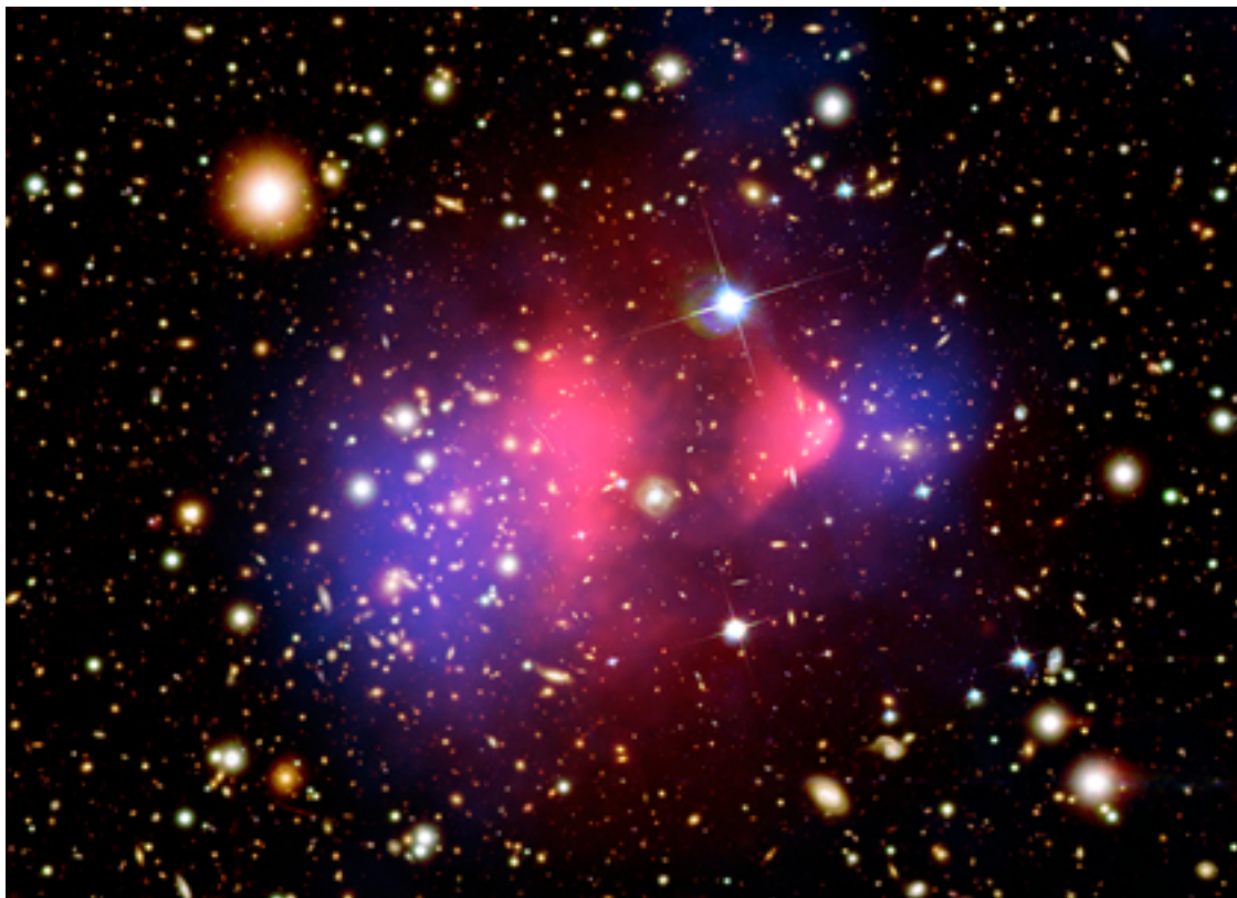
Figure 3 : La collision entre deux amas, appelée le Boulet. En rouge est représentée l'émission en rayons X du gaz chaud intra-amas, et en bleu la cartographie de masse totale, déduite des lentilles gravitationnelles faibles. Le tout est superposé sur une image optique du ciel, les galaxies des amas sont des taches blanches concentrées à gauche dans l'amas le plus massif, et à droite dans le petit amas, qui vient de traverser le gros. Noter le cône rose à droite,

MOND a des problèmes dans les amas de galaxies : les régions où le champ de gravité est plus faible que a_0 ne sont pas assez nombreuses, et la gravité modifiée ne peut rendre compte que d'une partie de la matière noire. Toutefois, le recensement de tous les baryons n'est pas encore terminé, et il est possible de se servir des baryons obscurs pour résoudre le problème. Ceci est mis en lumière lors de la collision entre amas de galaxies, comme dans le cas du célèbre boulet (cf fig. 3). Dans la collision, le gaz chaud émetteur de rayons-X est freiné, alors que les galaxies et la matière noire se traversent sans se voir, il y a séparation de la matière ordinaire et exotique. La séparation en soi n'est pas le problème principal (dans une galaxie comme la Voie lactée, les baryons sont au centre et le halo noir autour).